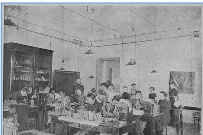
Бактериологический кабинет петербургского Женского медицинского института