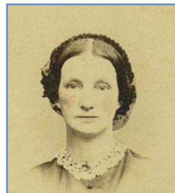
Ann Preston, 1867 г.

Несмотря на это, уважаемый профессор из Гарварда Эдвард Кларк всерьез предупреждал публику, что женщины, желающие высшего образования, будут страдать от увеличения