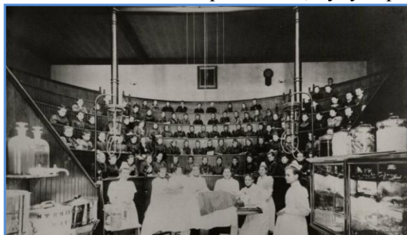
1895г. Лекция в Женском медицинском колледже в Пенсильвании

Вместо того чтобы обсуждать вопрос конкуренции умов, общество обсуждало конкуренцию полов, не в силах отказаться от базисной установки о мужском превосходстве. Все же, процесс было уже не остановить, благодаря спросу на женское образование последовало открытие других школ, колледжей и медицинских ассоциаций. Россия в этом вопросе не так уж