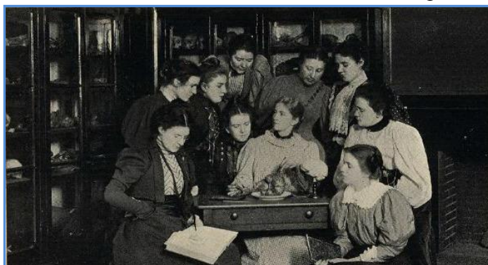
Изучение мозга. 1897 г.

Летом 1871 г. ездила в Гельсингфорс и, узнав от Ректора Университета и от профессора Эстландера условия поступления на медицинский факультет, занялась шведским языком и прошла у профессора Грубера «курс практической анатомии на трупах, как всякий студент медицины», получив свидетельство с отметкой «весьма удовлетворительно». Свое медицинское образование кончила в 1-м выпуске Высших врачебных курсов, 08.02.1878 г. Имеет диплом «Лекаря с отличием».